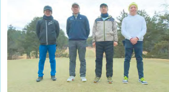
令和6年2月10日 田辺カントリーに於いて第3回ゴルフ同好会を開催

い時間を過ごしました。年2回の開催予定ですが、より多くの皆様のご参加をお待ちしております。